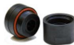
Capsule de protection pour une utilisation prolongée dans l'eau ou pour la stérilisation