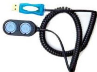
USB pour PC