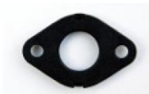
Œillet de Fixation