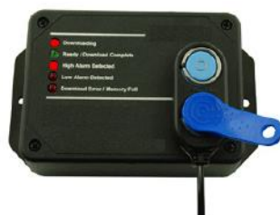
Ethernet - Sans PC