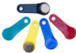
Porte clé de couleur